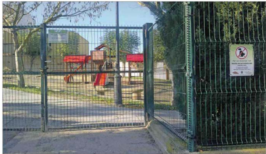
La verja cerrada impide el paso al parque y se han colocado carteles para evitar el acceso de perros. M. PERELLÓ

jada de temperaturas se reducirá notablemente la presencia de pulgas y no proliferará la plaga, una situación que sería peligrosa dada la ubicación del centro de salud del municipio frente al parque. Con la medida se pretende evitar que los niños padezcan las picaduras de los pequeños neópteros y la aparición de nuevos brotes en la zona recreativa.