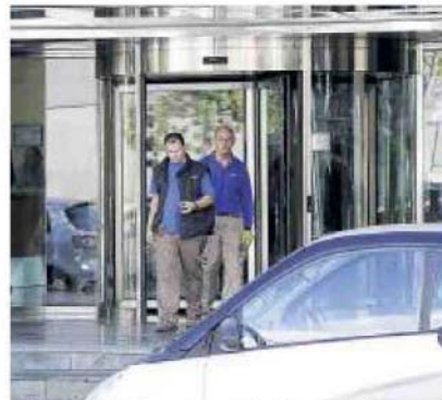
Entrada a l'edifici, que fou assaltat de matinada.