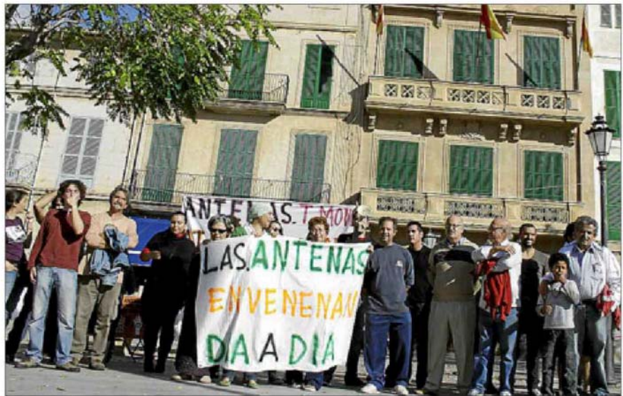
Vecinos de las 'bahías' concentrados el sábado pasado frente al Ajuntament de Llucmajor.

El alcalde Joan Jaume Mulet (PP) informó ayer al pleno municipal de las pesquisas iniciadas por Salut después de que los parti-