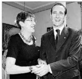
Joana Barceló y el presidente Bauzá.

un nuevo centro al Conservatori y la Escola d'Adults, completar las reformas pendientes en los institutos de secundaria Joan Ramis y Pasqual Calbó de Maó y convertir la residencia Verge del Toro en un centro sociosanitario. Ésta «aclaró» siendo su apuesta para el antiguo hospital, aunque el actual gobierno del Partido Popular sopesa ahora la posibilidad de compatibilizar este uso con un centro insular de formación que englobe de paso la enseñanza de adultos.