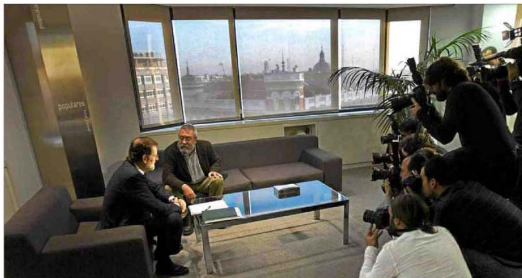
El presidente electo, Mariano Rajoy, y el líder de UGT, Cándido Méndez, conversan frente a los fotógrafos, ayer en la sede del PP.