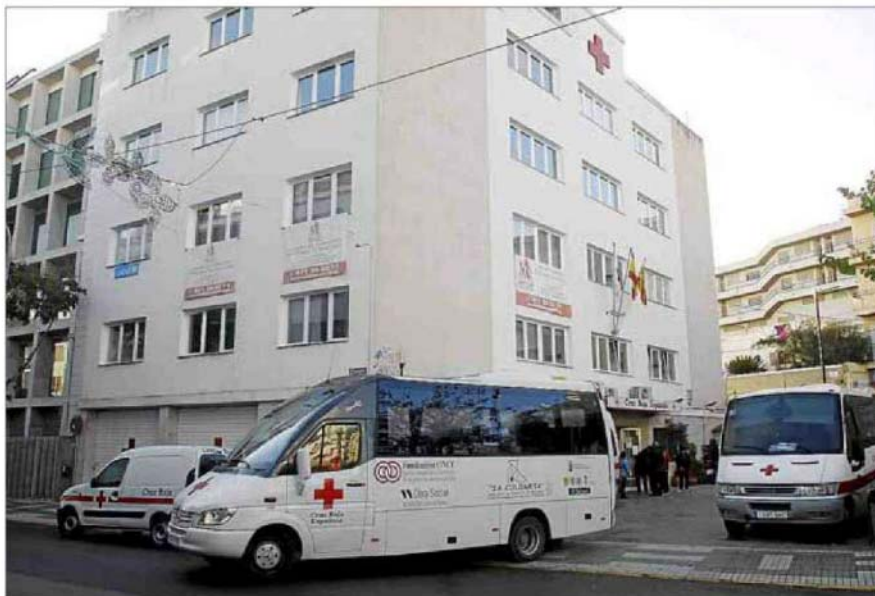
El transporte de personas mayores y con necesidades especiales es uno de los programas principales de Cruz Roja.

▲ Preparados para el viaje. El programa de transporte adaptado de Cruz Roja ayuda a que personas con necesidades especiales y de la tercera edad puedan llegar a su destino sin ningún tipo de problemas. En total participan 3 autobuses, 1 furgoneta y un 1 mini bus que sirven para trasladar a unas 15 personas con discapacidad en cada uno y a unos 19 mayores.