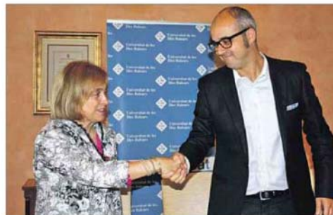
La UIB i Orizonia formalitzen l'establiment de la nova càtedra.

La Universitat de les Illes Balears compta amb 22 càtedres, algunes creades amb el suport d'institucions públiques, com el Govern de les Illes Balears, i altres a partir del finançament d'empreses privades.