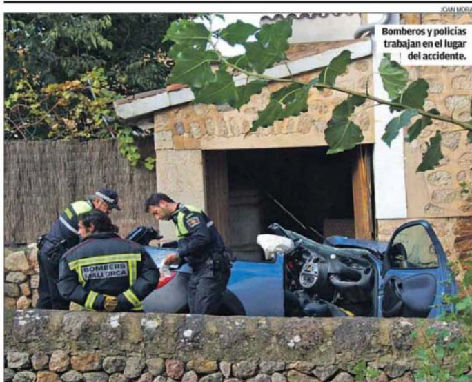
Bomberos y policías trabajan en el lugar del accidente.

■ Expertos del Imedeja y de la UIB alertaron ayer sobre los efectos en el litoral de la ampliación de puertos deportivos prevista por el Govern. El GOB y la izquierda anunciaron movilizaciones si la medida sigue adelante. P 3