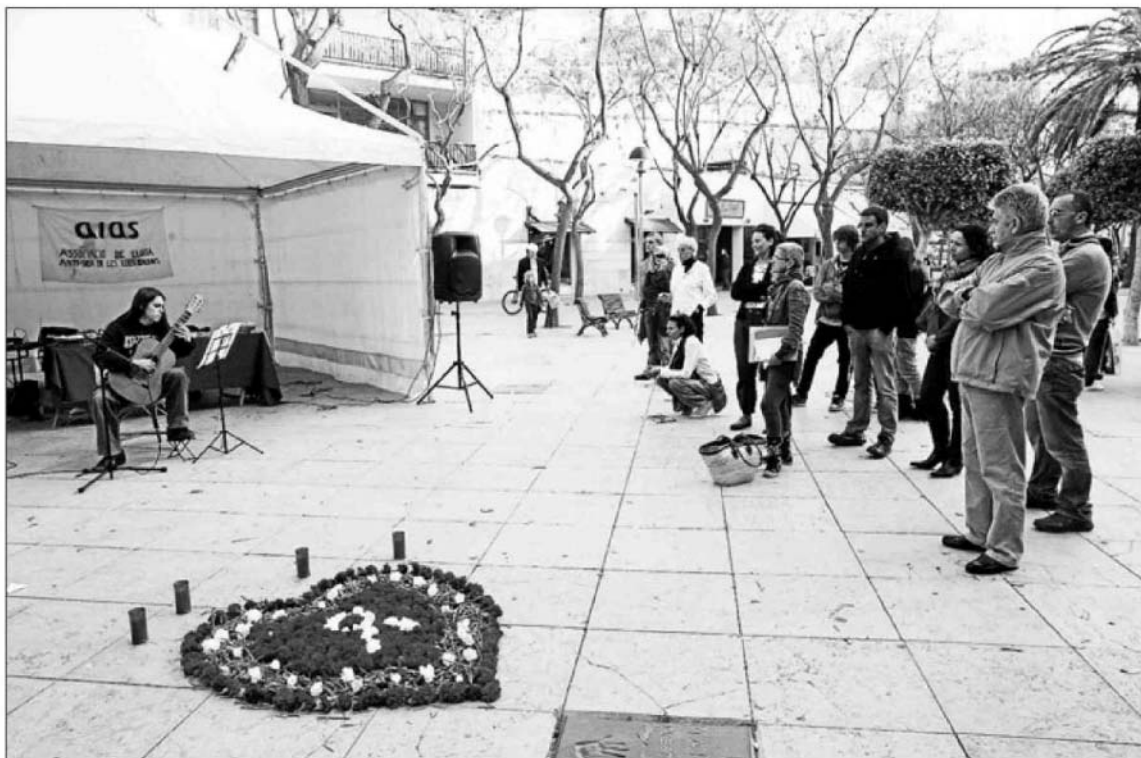
Memorial por los fallecidos de sida celebrado por ALAS el año pasado. J. A. RIERA

De la misma manera, destacó que también están aumentando las infecciones en las mujeres. «En la relación heterosexual la mujer es más sensible que el hombre a la infección», apunta. Así, aunque en el total de pacientes de la unidad hay un 65% de hombres y un 35% de