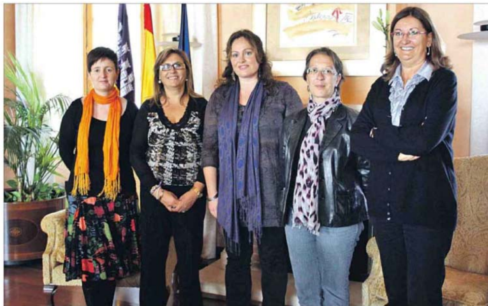
Aquest dimarts, la Càtedra d'Estudis de Violència de Gènere ha lliurat el IV Premi d'Investigació sobre Violència de Gènere. UIB