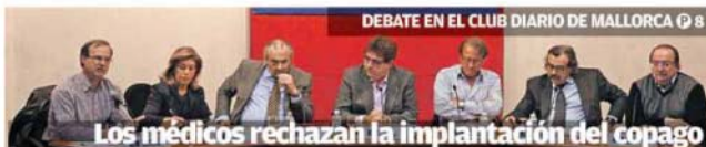
DEBATE EN EL CLUB DIARIO DE MALLORCA

Los médicos rechazan la implantación del copago