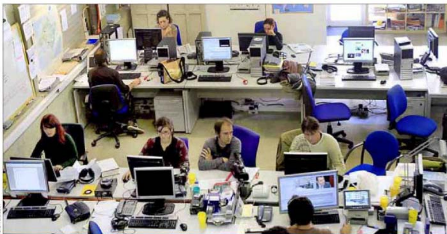
Imagen de la redacción de Televisió de Mallorca preparando, ayer, uno de los últimos informativos.