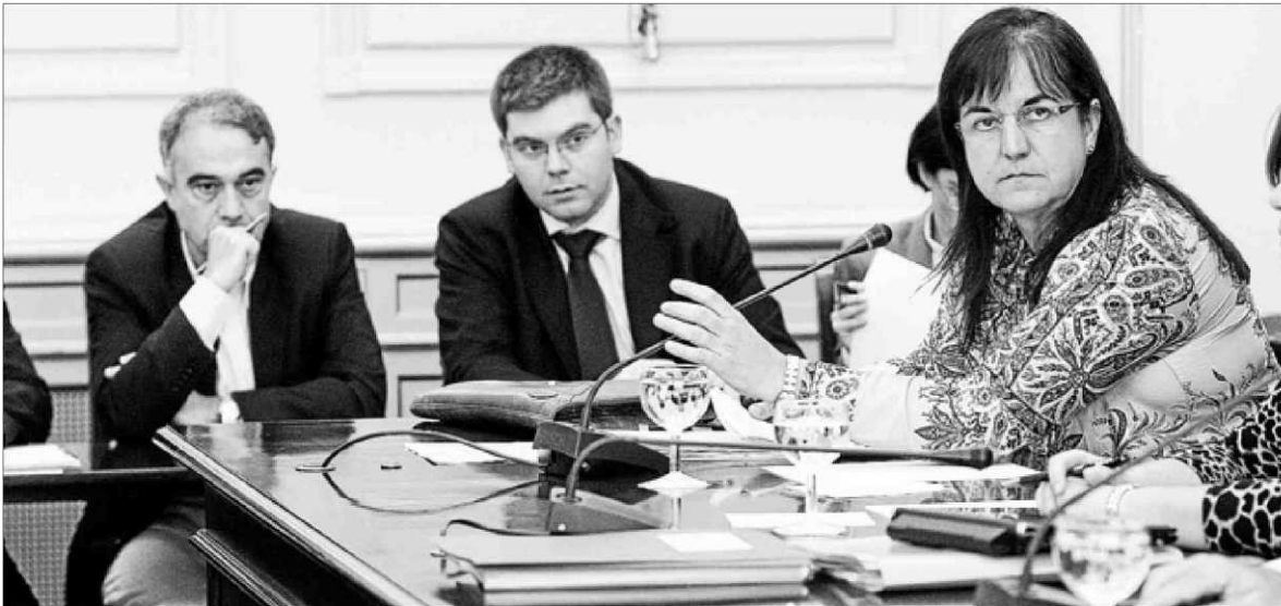
Castro explica las cuentas de la sanidad balear para 2012 en la comisión del Parlament.