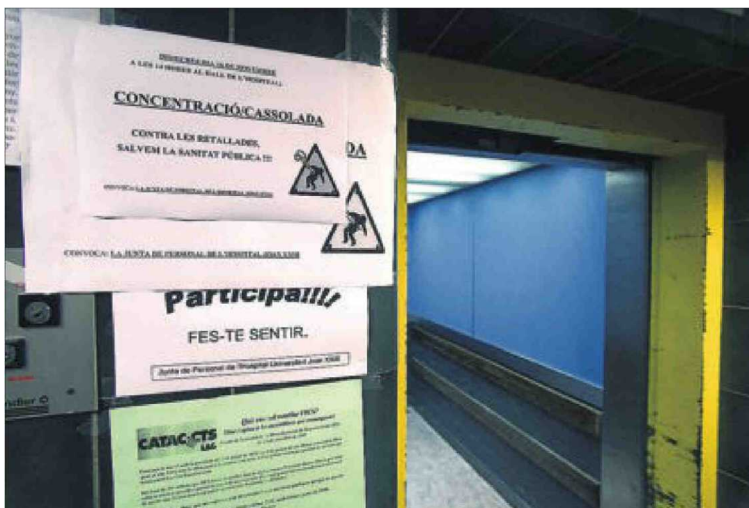
Carteles de convocatorias de huelgas y protestas en el hospital Joan XXIII de Tarragona.