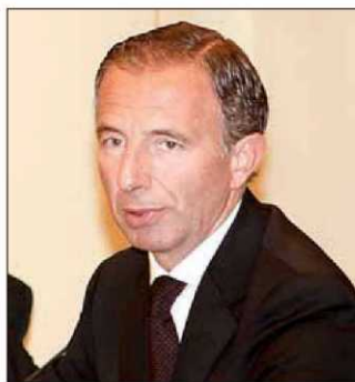
El conseller de Turismo, Carlos Delgado.

► Menos subvención, más avales de crédito. También rebaja los presupuestos de estas áreas y de Innovación -en conjunto 33 millones, sobre todo en subvenciones-. Por contra, aumenta las cuentas de Tesoro y Política Financiera en dos millones para avalar los créditos ISBA a pequeñas y medianas empresas.