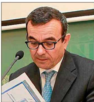
El vicepresidente Josep Ignasi Aguiló.

► Dependencia. La oposición afirmó que los 13 millones reservados para las ayudas a la dependencia «sólo durarán cuatro meses». La consellera contestó que son partidas ampliables y que el presupuesto de Asuntos Sociales se mantiene en 94,8 millones.