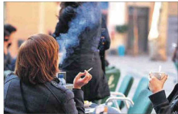
Algunas marcas han incorporado ya los nuevos pitillos. / TEJEDERAS

A su vez, el comisario aprovechó para recordar que el consumo de tabaco es el mayor riesgo evitable para la salud, ya que