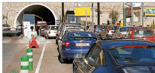
Imagen del túnel lleno de coches esperando para pasar.