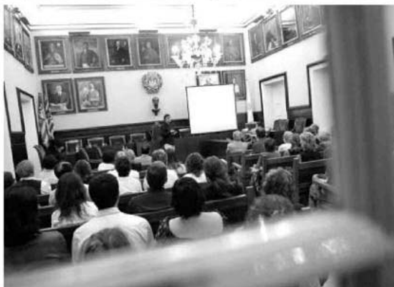
ASISTENTES. Unas 60 personas atendieron a las explicaciones de los expertos en el Ayuntamiento