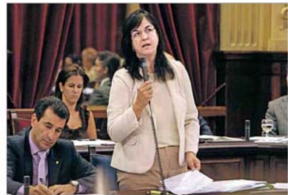
La consellera de Salud, ayer en el Parlament. M. MASSUTI

La consellera insistió en que ninguna prestación se verá afectada, "todo lo contrario" de lo que hizo el gobierno autonómico del Pacte de la pasada legislatura, apostilló Castró, quien recriminó a Thomàs que él, como ex conseller de Salud en los últimos cuatro años, redujo las prestaciones sanitarias un 29 % solo en 2011, una situación que el actual ejecutivo "resolverá" con la aprobación de las cuentas del próximo año. "Usted dejó una deuda sanitaria a proveedores a 31 de agosto de este año de más de 500 millones de euros", señaló. Ejemplo de ello, citó, es que la Asociación de Viajes de Baleares