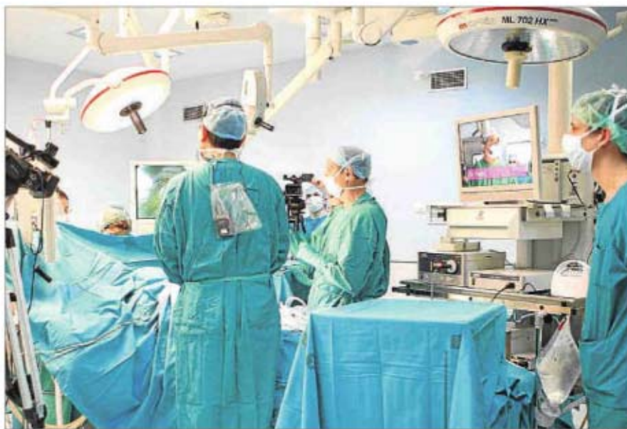
LL PND / EE

"No podemos reducir todas las patologías a un puro tiempo de espera y un número porque hay factores que tienen un papel más importante en la calidad de vida", defendió en RAC1, el secretario de Estrategia i Coordinació