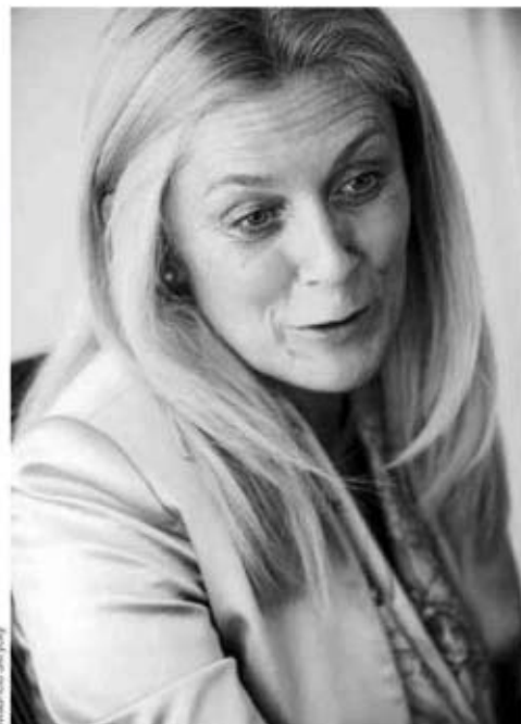
Elvira Sanz, presidenta de Pfizer en España.

Las continuas rebajas de precios de referencia y planes de contención del gasto aprobados por el Ministerio de Sanidad han precipitado una oleada de ajustes de plantilla en el sector farmacéutico en España. Sanofi Aventis anunció el año pasado un ERE para reducir su plantilla española en 200 personas y Roche ha su-