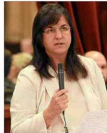
La consellera de Salud, Carmen Castro.

Además, recordó que, debido a los impagos del anterior Govern, la Asociación de Viajes de Baleares (Aviba) dejó de prestar este año su servicio de transporte de enfermos de las islas menores y a la Península.