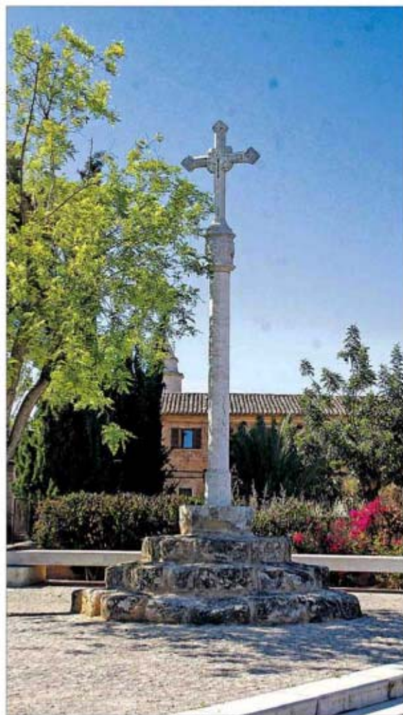
La 'creu dels monjos' en su ubicación actual. LORRENZO

El Tribunal Superior rechaza de plano el razonamiento de la primera instancia y desmonta tanto la argumentación jurídica como la decisión a la que llega, puntualizando que ni la seguridad jurídica ni el paso del tiempo ni esos supuestos derechos surgidos a favor de determinados sujetos son razón suficiente para no estimar el recurso de apelación presentado ante el TSJB, así como la revocación de la sentencia del juzgado número 1 de lo contencioso-administrativo de Palma. "Los efectos del paso del tiempo no amparan lo que pretende la resolución administrativa recurrida, ni tampoco son suficientes en sí mismos para superar el obstáculo que supone una nulidad de pleno derecho" como la reclamada.