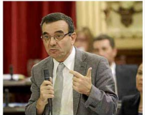
AGUILÓ HA D'IMPROVISAR Per un error d'algun subordinat, ni el vicepresident Aguiló ni el president Bauzá no havien preparat una pregunta d'Armengol. Aguiló hagué d'improvisar.