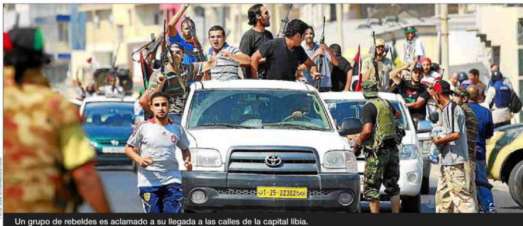
Un grupo de rebeldes es aclamado a su llegada a las calles de la capital libia.