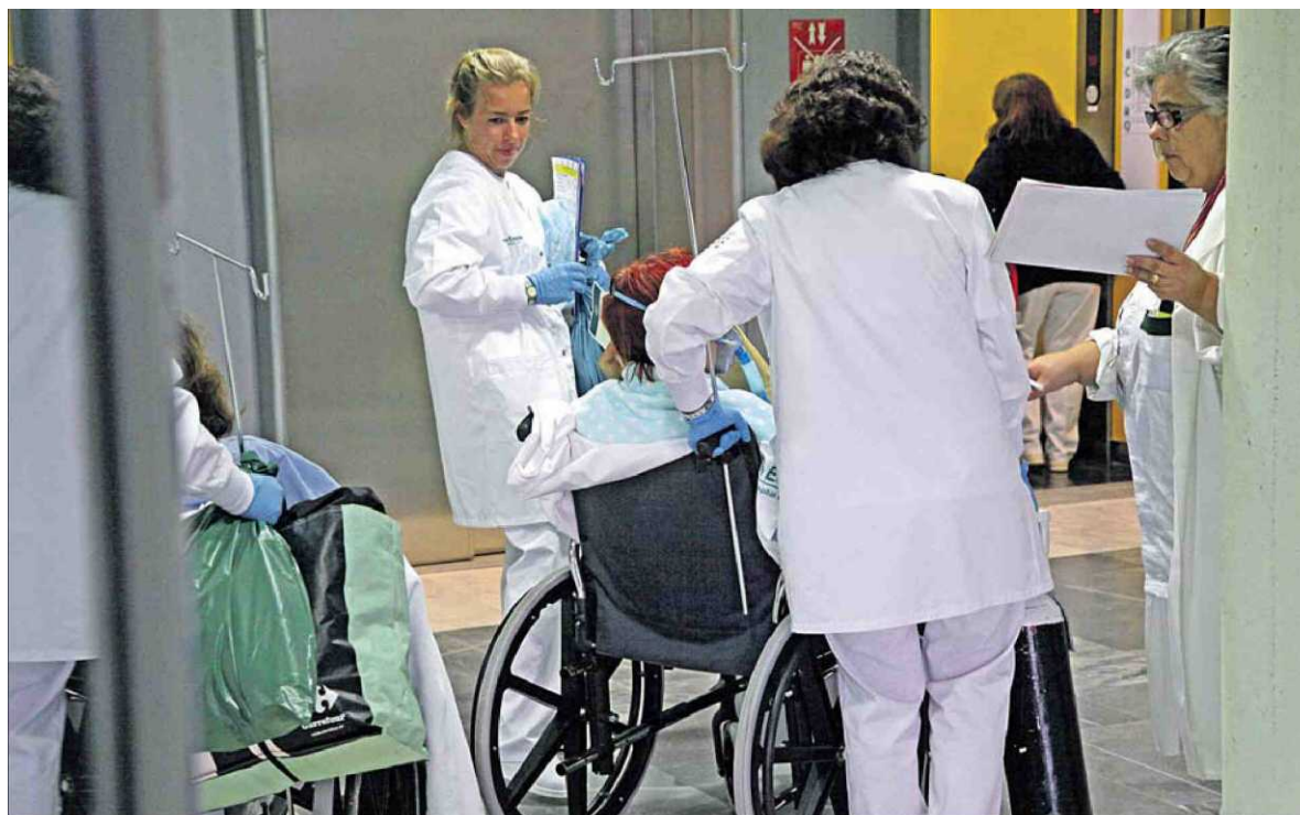
En Sanidad existen unos 2.000 funcionarios interinos que trabajan, esencialmente, en los hospitales del Govern. B. RAMON