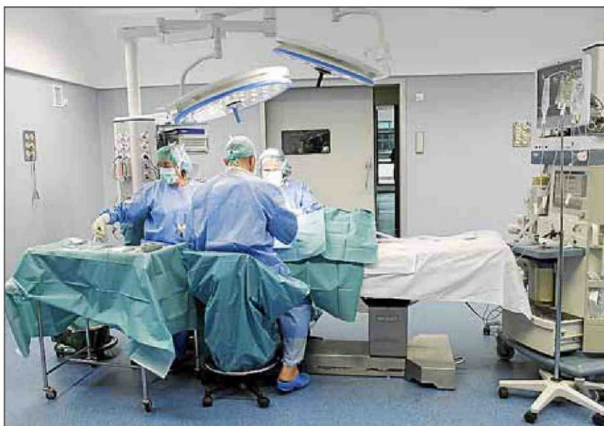
Imagen de una intervención quirúrgica realizada en el Hospital Son Espases.