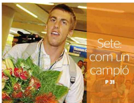
Sete: com un campió P 31