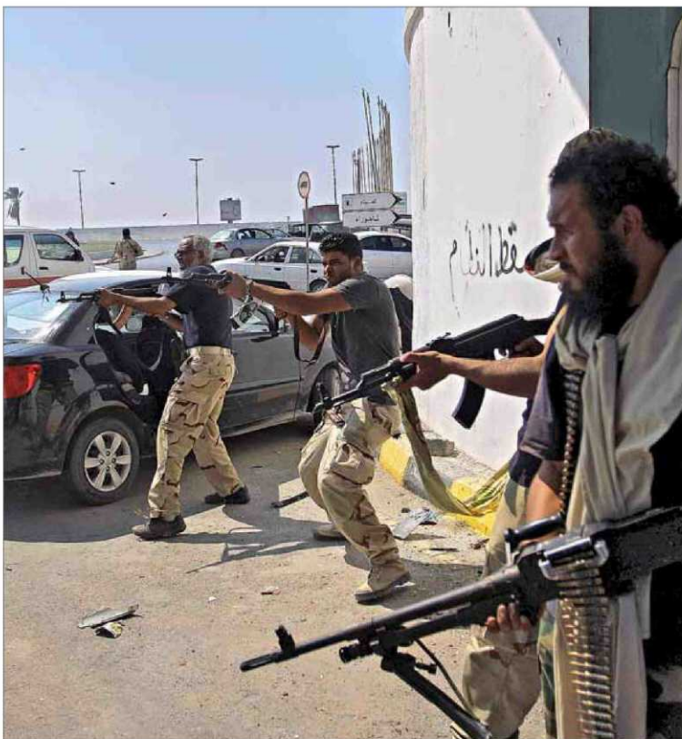
Rebeldes libios disparan contra tropas leales a Gadafi, ayer, en una céntrica calle de Trípoli.