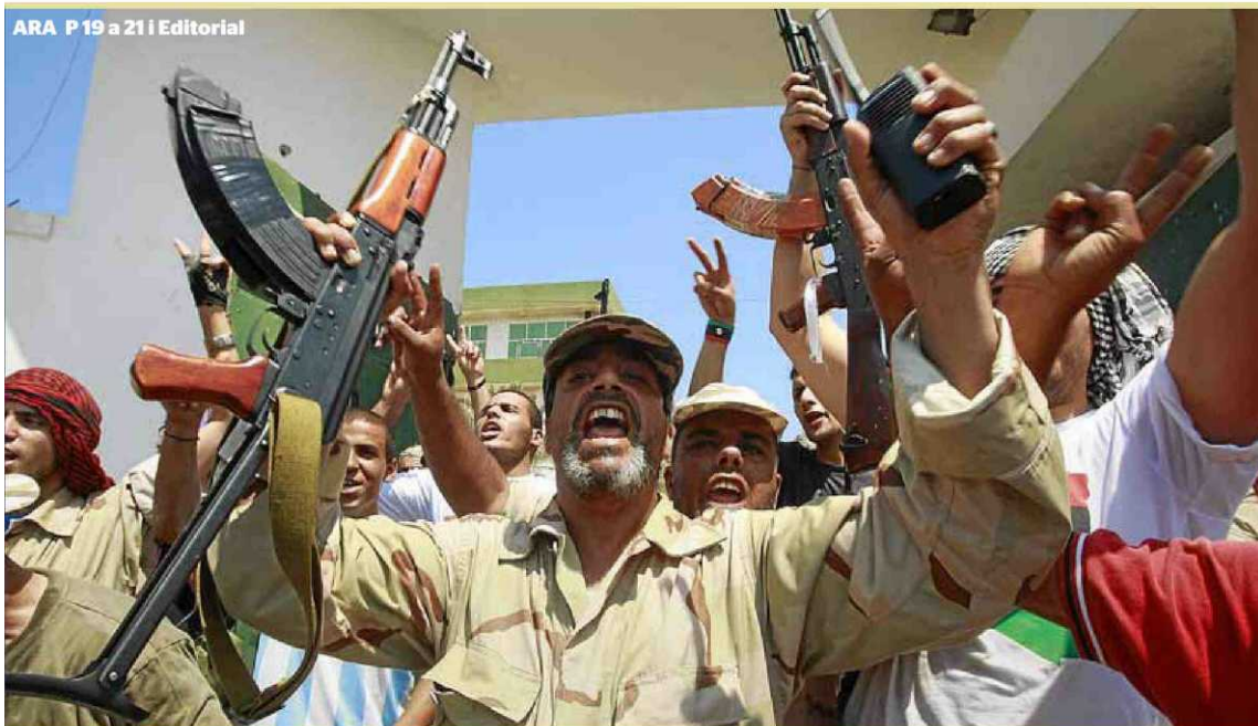
Forces rebels, ben armades i amb uniforme, exhibiren eufòria per la capital. Són les hores finals d'un règim que semblava etern.