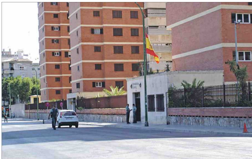
Imagen de las dependencias de la Guardia Civil en la calle Manuel Azaña.