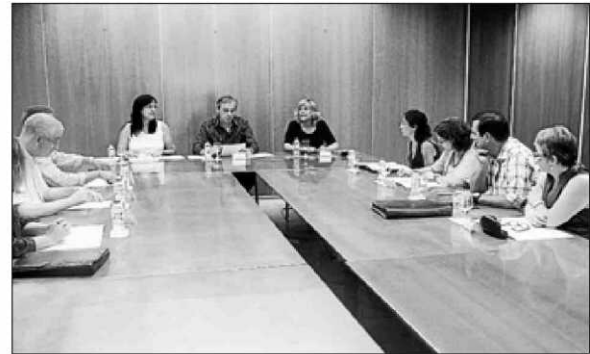
Imagen de la Junta Rectora, ayer. CONSELL