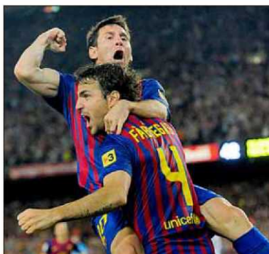
Messi y Fàbregas, anoche en el Camp Nou.