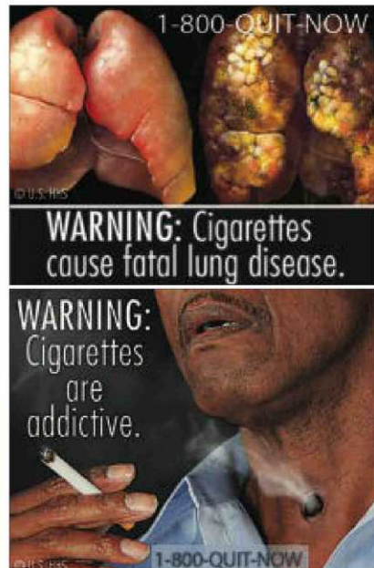
Bebés prematuros, pulmones enfermos y tráqueas perforadas ilustran algunos de los carteles de la campaña contra la adicción al tabaco.