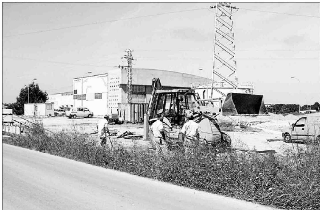
Imagen de la planta desalinizadora de es Ca Marí durante su ampliación en 2002. c. c.

Las consellera de Medio ambiente de Formentera, Silvia Tur, señaló ayer por la tarde que la medida preventiva de recomendar que no se utilice el agua se había adoptado porque así lo establece un protocolo, dado que los análisis que indican la elevada concentración de cloruros procedían