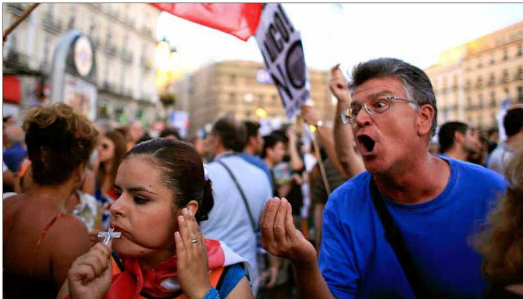
Una joven besa un crucifijo, ayer en la Puerta del Sol, mientras es increpada por un miembro de la manifestación laica.

Un genio masón, el preferido del Papa El Vaticano nombró caballero a Mozart para protegerle en el XVIII