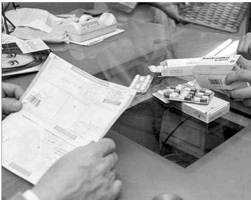
Un paciente adquiere medicamentos en una farmacia.

millones de euros es el ahorro en medicamentos que aportará el recorte del Gobierno, cifra que se suma a los 2.500 millones reducidos en 2010.