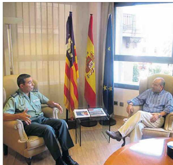
Un momento de la Audiencia en la sede de Presidencia.