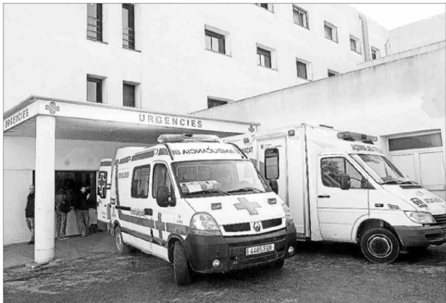
Dos ambulancias delante de Urgencias de Can Misses, en una imagen de archivo. M. C.

«No estamos del todo satisfechos con el acuerdo porque todo el mundo hubiera preferido que nos pagasen de una vez, no a plazos, pero creemos que es lo más conveniente para todos los trabajadores, ya que todo el mundo quiere cobrar», explicó el sindicalista. «Seguimos sin entender por qué tenemos que partir los pagos de esta retribución extra, aunque entendemos que la situación económica es complicada», afirmó el miembro del Comité de Empresa.