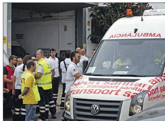
Una imagen de las últimas huelgas en el sector.