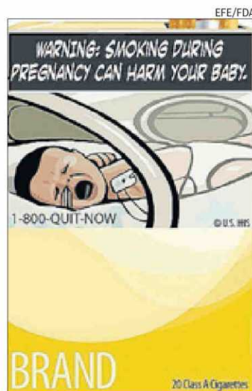
Una de las imágenes.

Según recoge el diario R.J. Reynolds Tobacco Co. y Lorillard To-