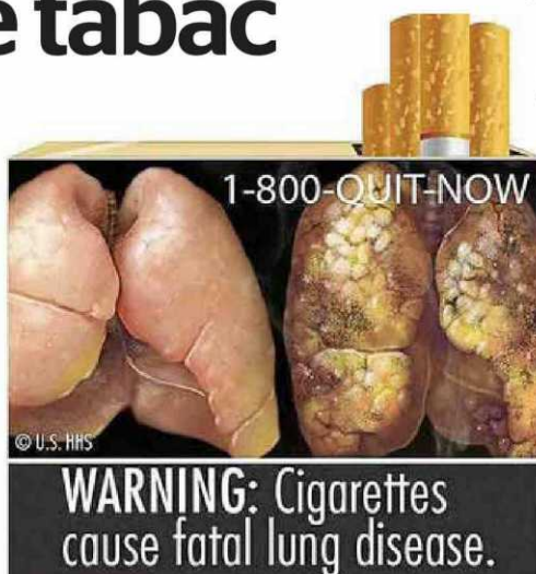
Pulmons malalts cobreixen els paquets de tabac.

El tabac és la principal causa de morts evitables als Estats Units. Cada any hi mata 443.000 persones, 1.200 al dia. Encara que el nombre de fumadors ha baixat significativament al país en els últims 40 anys, aquest declivi s'ha estancat recentment i, avui, al voltant d'un 20 per cent de la població -46 milions d'adults- consumeix cigarrets. • Efe