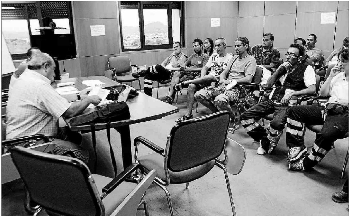
Los trabajadores se reunieron ayer por la tarde en Can Misses para desconvocar los paros.