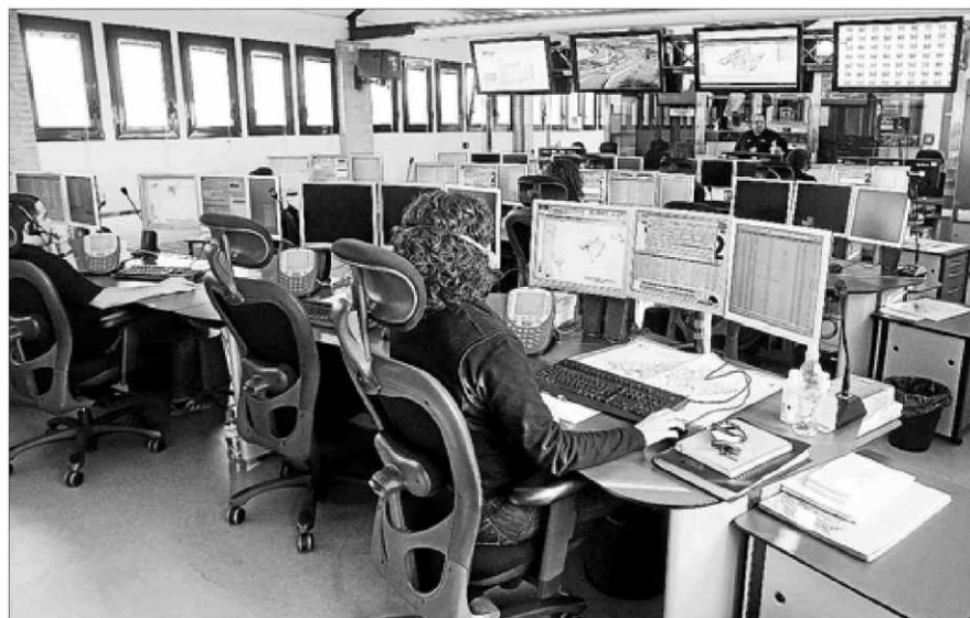
El centro 112 ha recibido de enero a junio 290 llamadas por casos de violencia de género. D.M.

También se señalan siete llamadas reclamando asistencia médica en domicilio y otras dos en la vía pública (también suelen co-