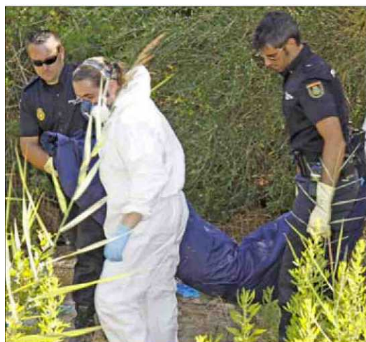
Agentes del Cuerpo Nacional de Policía y operarios de Pompas Fúnebres, sacando al fallecido de Palma de entre los matorrales.