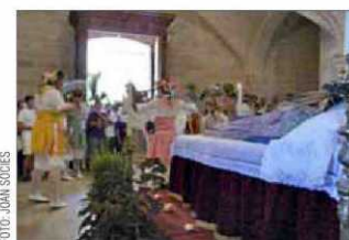
Momento de la interpretación de 'Gentil Senyora' ante el Llit de la Mare de Déu.

Can Picafort celebra su suelta de patos, esta vez sin aves vivas