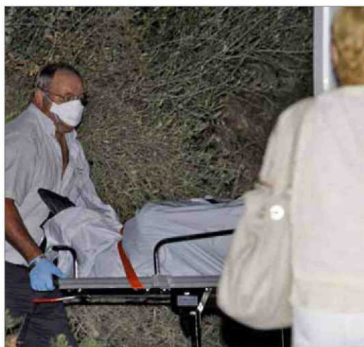
Momento en que el cadáver hallado en Lloret es trasladado a Palma, donde se le realizará la autopsia.