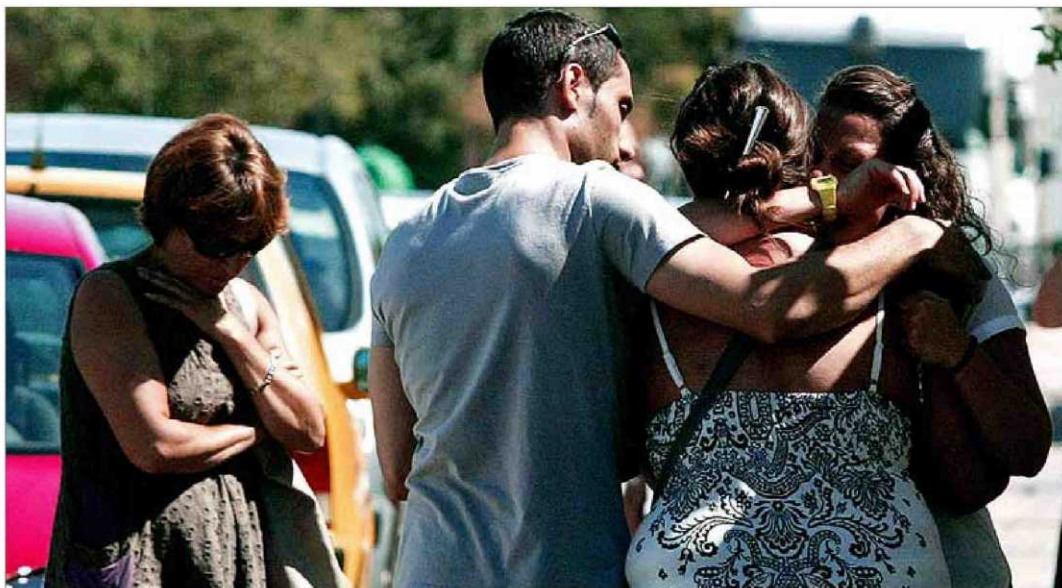
Una mujer recibe el consuelo de dos jóvenes, ayer, a las puertas del centro de acogida de Boecillo (Valladolid), donde ocurrió la tragedia.