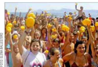
Los participantes en la suelta de patos de goma, mostrando sus capturas.

Can Picafort celebra su suelta de patos, esta vez sin aves vivas