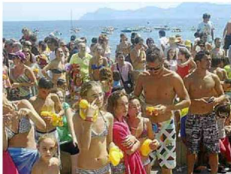
Molts eren feliços amb un ànec de jugueta.

El llançament d'ànecs de plàstic a Can Picafort va tenir lloc ahir sense incidents ni ensurts. Per primer cop des de 2007, no hi hagué cap amollada subversiva d'aus vives. Els emmascarats no hi feren acte de presència. En total, es tiraren a l'aigua 1.500 animals de goma que escamparen l'alegria entre la gentada que gaudia de la festa. El desplegament de la Guàrdia Civil va ser semblant al d'altres anys. •