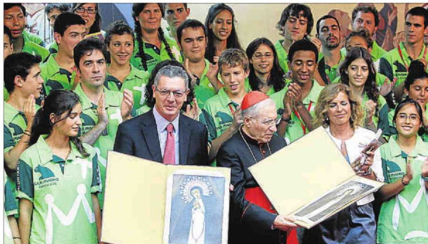
Alberto Ruiz-Gallardón, Rouco Varela y Ana Botella, junto a voluntarios de la JMJ ayer en Madrid

Ayer mismo el ministro de Fomento y portavoz del Gobierno, José Blanco, aseguró que el Ejecutivo “cumplirá con su deber” durante la inminente visita del Papa. En una entrevista a Europa Press, Blanco confirmó que asistirá a la misa que Benedicto XVI celebrará en Cuatro Vientos, al tiempo que defendió que la visita se ha organizado “de manera aus-