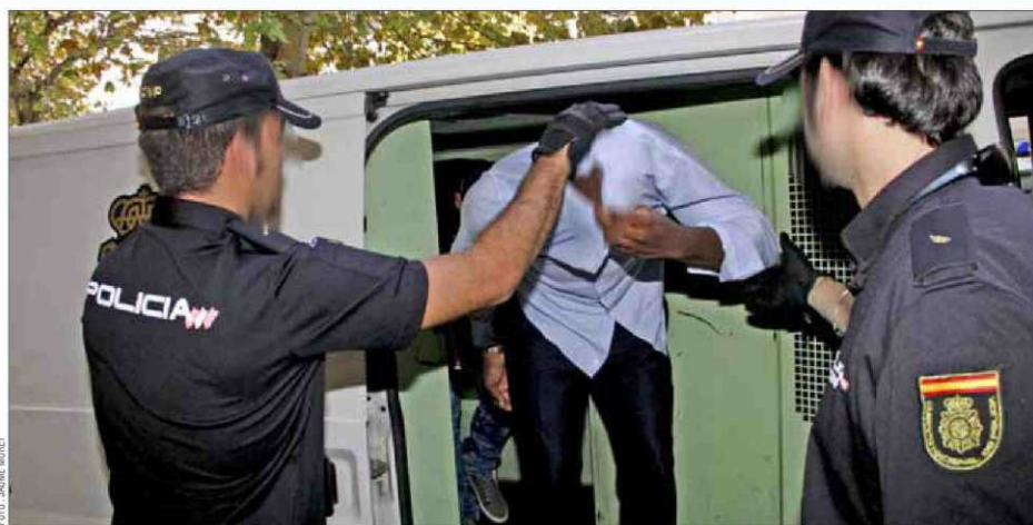
Los tres responsables fueron puestos a disposición judicial en la tarde de ayer en los juzgados de Vía Alemania.