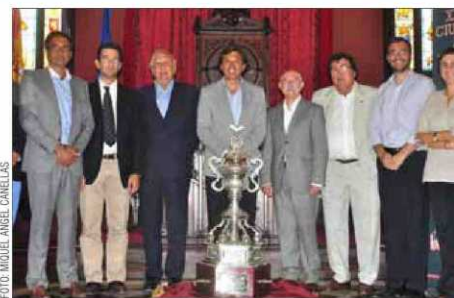
Imagen de la presentación del Trofeu Ciutat de Palma.

DEPORTES • Páginas 40 y 41 Serra Ferrer defiende la «calidad y competitividad» de 'su' Mallorca