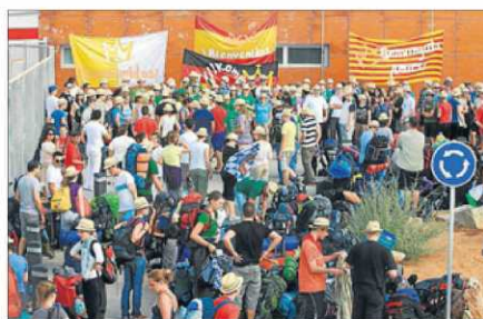
El grupo alemán, ayer, a su llegada a Sant Antoni.

■ Los primeros grupos de jóvenes extranjeros que prepararán en Eivissa su encuentro con el Papa en la Jornada Mundial de la Juventud de Madrid desembarcaron ayer en la isla. Franceses y alemanes fueron los primeros en llegar. P 33