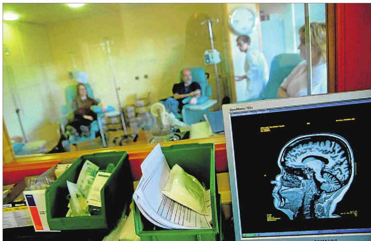
Pacientes españoles. Casi un millar de las muestras de ADN que se han secuenciado para determinar el genoma de la esclerosis múltiple proceden de pacientes del Centre d'Esclerosi Múltiple de Vall d'Hebron, en la foto, y del Clínic

Un megaestudio de la genética de la enfermedad detecta 29 nuevas alteraciones