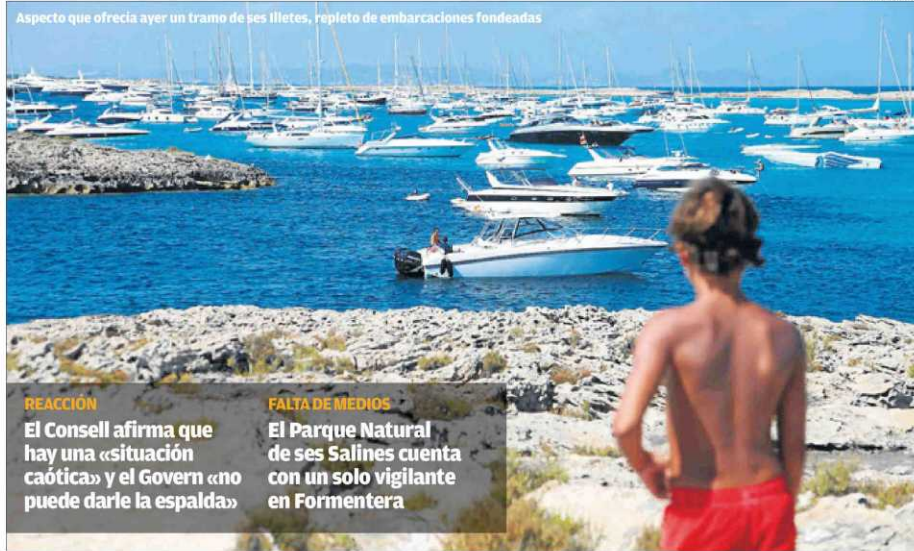
Aspecto que ofrecía ayer un tramo de ses illetes, repleto de embarcaciones fondeadas