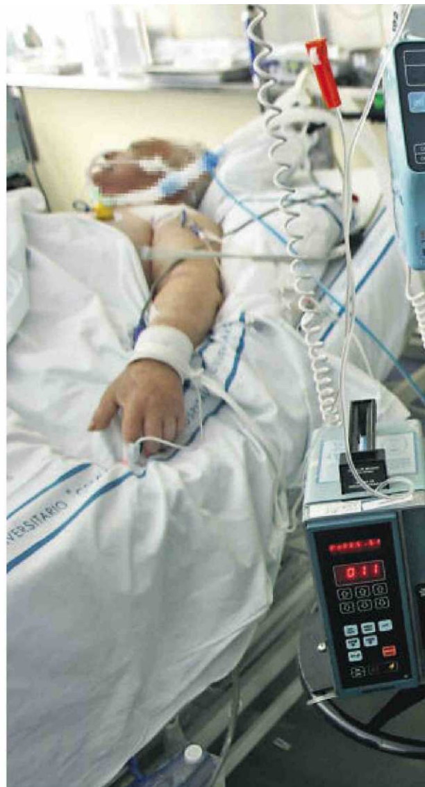
La tecnología permite prolongar la vida de los pacientes terminales sin esperanza de mejoría alguna.

que afirman que su ética les obliga a pinchar, a ponerle una vía”, aunque no vaya a haber una mejoría, solo para evitar que se muera.