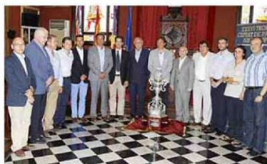
Ve el Ciutat de Palma P 28