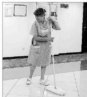
Una camarera de pisos.

Más de un 42% de los trabajadores de la hostelería con más de seis años de antigüedad en la profesión necesitan tomar algún tipo de analgésico antiinflamatorio para iniciar la jornada y paliar los riesgos laborales en su salud, según un informe de CCOO. EPR