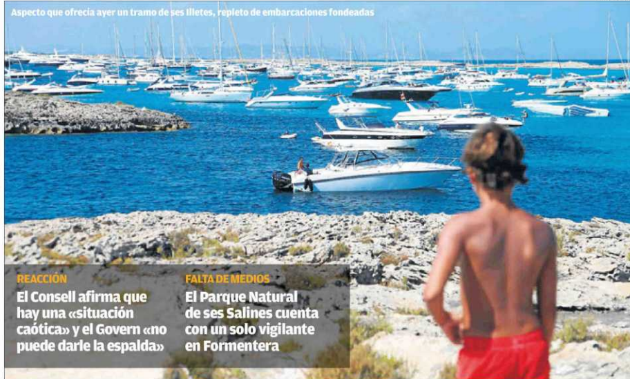
Aspecto que ofrecía ayer un tramo de ses illetes, repleto de embarcaciones fondeadas