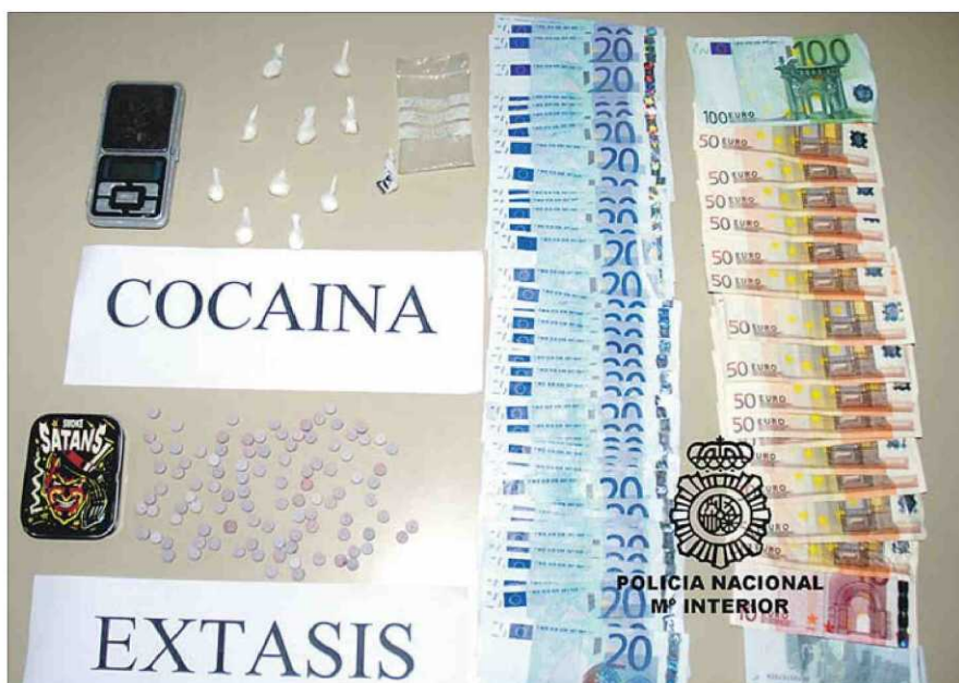
Drogas y dinero incautado por la Policía al joven austriaco. C.N.P.

El joven que llevaba la droga culpó a sus acompañantes y aseguró que estos no sabían nada de las drogas. El juez de guardia ordenó su ingreso en prisión por un delito contra la salud pública y dejó en libertad a otros dos acusados.