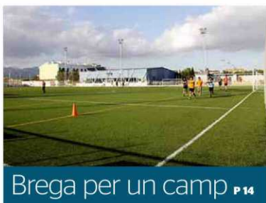
Brega per un camp P 14