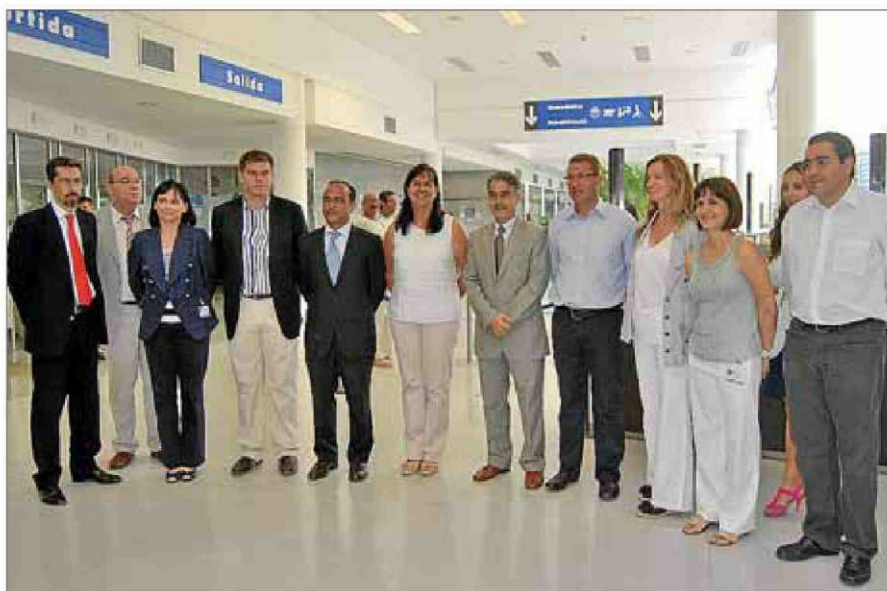
La consellera Castro se reunió con el equipo directivo del hospital.

Segundos Santiso, «si fuéramos una empresa privada, estaríamos en situación de quiebra técnica». El balance negativo