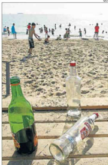
Restos de botellón en Eivissa.

La edad a la que los jóvenes tienen su primera toma de contacto con el alcohol se ha retrasado res-