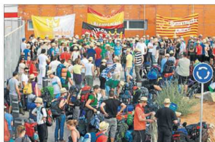
El grupo alemán, ayer, a su llegada a Sant Antoni. J. A. RIERA

■ Los primeros grupos de jóvenes extranjeros que prepararán en Eivissa su encuentro con el Papa en la Jornada Mundial de la Juventud de Madrid desembarcaron ayer en la isla. Franceses y alemanes fueron los primeros en llegar. P 33