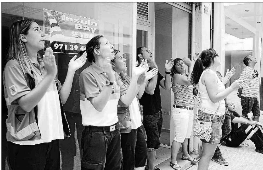
Un grupo de trabajadores aguardó ayer ante el Tamib durante la reunión con la empresa.

nalidad de los trabajadores, «que se han comprometido a cubrir con la sociedad ibicenca los servicios urgentes y programados y no hemos