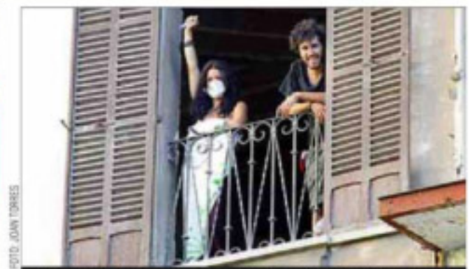
'Okupas' saludando a los concentrados que los apoyan.