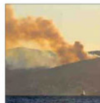
El incendio desde el mar. / A.V.