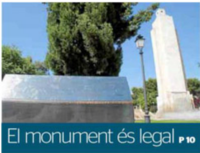
El monument és legal P 10