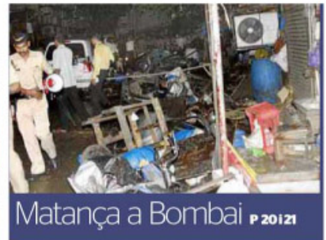
Matança a Bombai P 20121