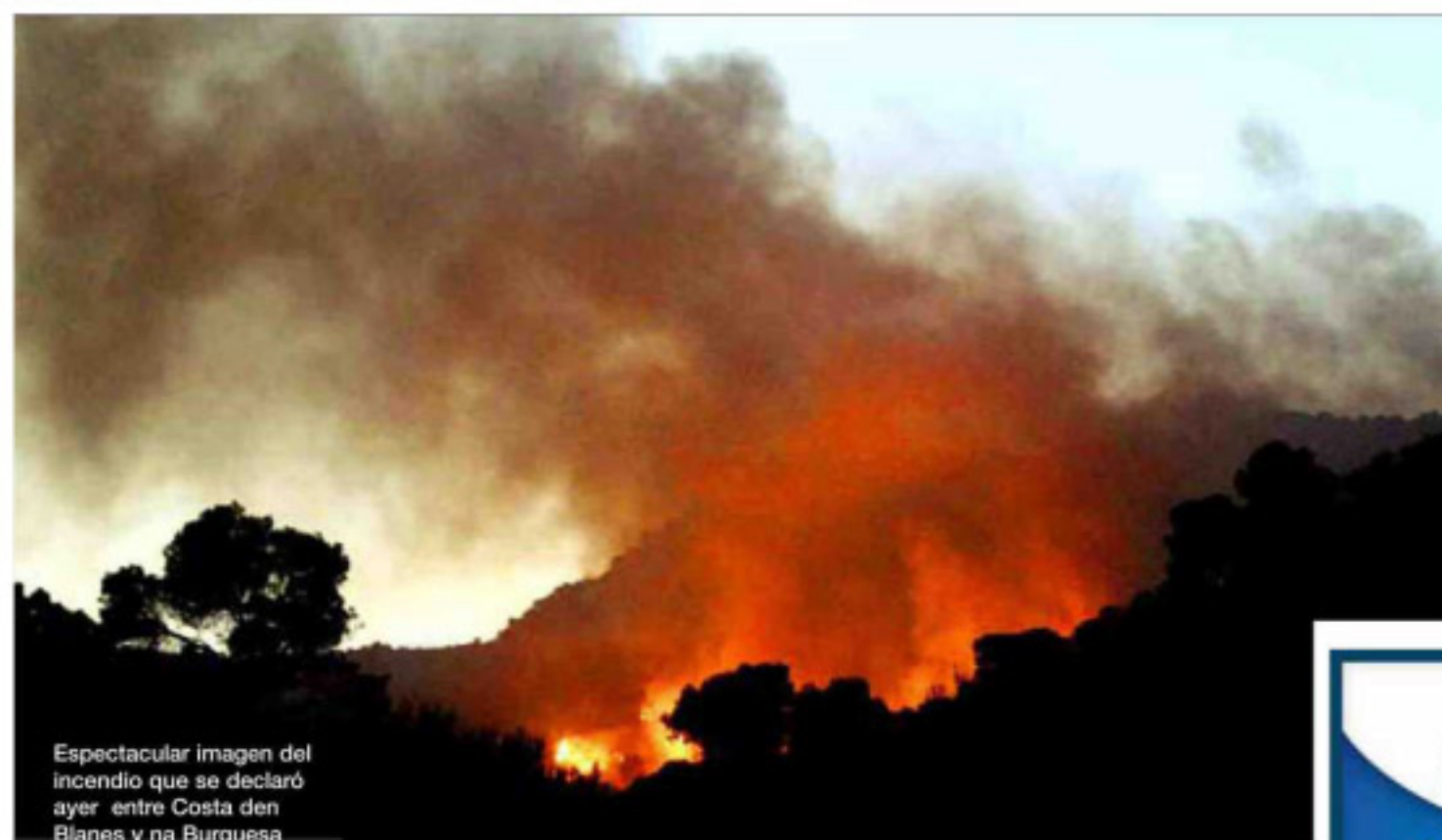
Espectacular imagen del incendio que se declaró ayer entre Costa den Blanes y na Burguesa

El cambio en el Ciutat de Palma de Còmic indigna a los dibujantes