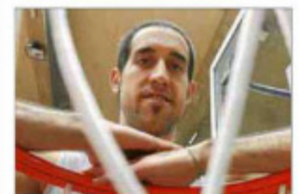
El allicantino posa en una canasta.