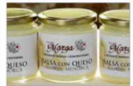
Salsa de queso Mahón-Menorca. El restaurante Ca Na Marga de Fornells presentó una original salsa.