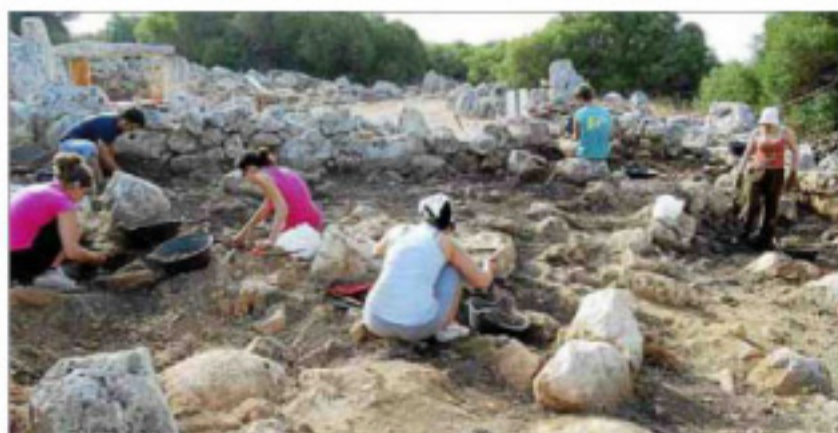
Nueve estudiantes universitarios de arqueología trabajan en Torre den Galmés.