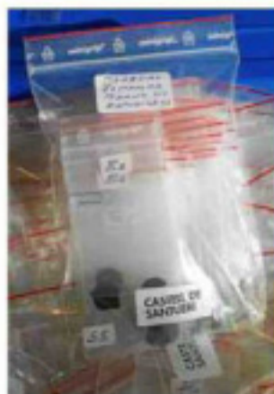
Patrimoni que s'ha esfumat P 36