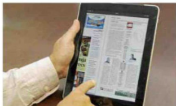
Informació en un clic P 48